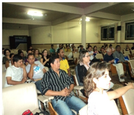
Professores e acadêmico prestigiam o evento